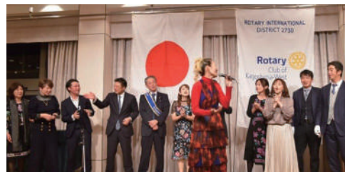
クリスマス家族会(城山ホテル鹿児島 4F レインボー)