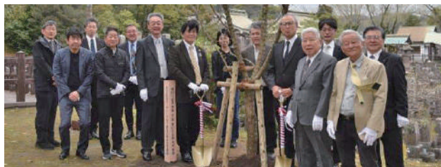
60周年記念植樹(南洲公園)