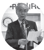
▲下関東RC 55周年で挨拶