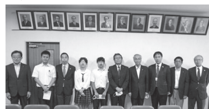
▲鹿児島高校奨学金贈呈