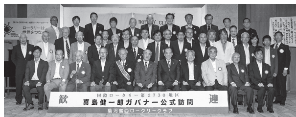
▲喜島ガバナー公式訪問