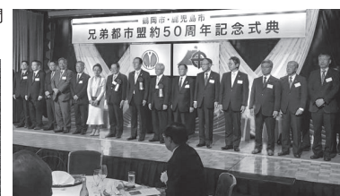
▲鶴岡市兄弟盟約50周年式典に出席