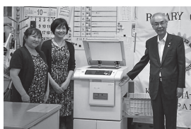
▲中洲児童クラブに印刷機を寄贈