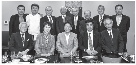
下関東RC クラブ訪問