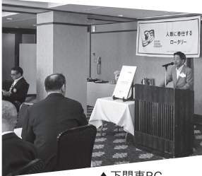
▲下関東RC クラブ訪問で挨拶