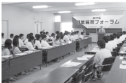
●第16回 職業選択フォーラム