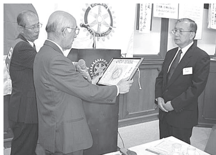
●元鹿児島高等学校 インターアクト顧問 表彰