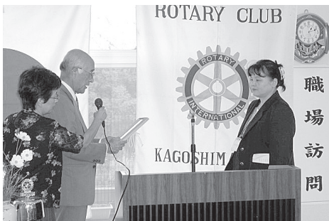
●職場訪問(特別養護老人ホーム 寿康園)