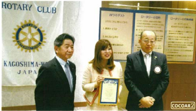
▲贈呈式の様子をARでご覧いただけます。 (ARアプリは下記QRコードからダウンロードできます。)