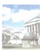
Illustration of a building, likely UCL.