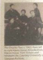
The Choshu 5 in 1863. From left to right: Kamekura, Kishida, Otsu, Matsuda, and Kamekura.

Sakoku A hundred and fifty years ago, Japan was a feudal state operating a policy of political and cultural isolation: alien visitors to their country's shores were treated with suspicion, and any attempt to leave was punishable by death. In 1853, following international bellicose pressure, Japanese ports opened up to foreign trade, and conflict-ridden Japanese nationalists were determined to protect their frontiers from foreign influence, and one of their supporters murdered a British merchant. In response, the British Royal Navy opened fire on the Japanese city of Kagoshima in 1853, leaving it in ruins.