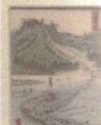
The world's first monument, produced in 1863 by the artist William Stanbury, which Shogun Ishikawa Homoyasu erected inside the Froyer's Palace on the island of foreign embassies, Country UCL Art Museum.

In the garden to your left is the Japan Monument, which celebrates two groups of young Japanese men who studied at UCL from 1863 and 1865, and afterwards played extraordinary roles in the history of modern Japan. They were not only the first Japanese students to enrol at UCL, but were also the first to study outside their country. The result was a strong and lasting connection between UCL and Japan.