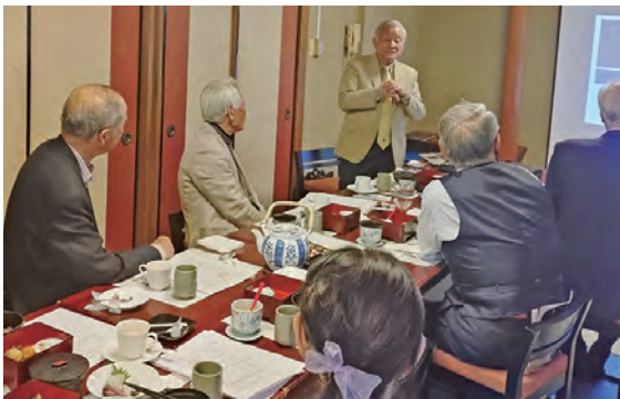
4月9日(木) 鹿児島西プロバスクラブ例会 古木会員の卓話「本、山そして仕事」で 好奇心を刺激されるとも楽しいお話でした。